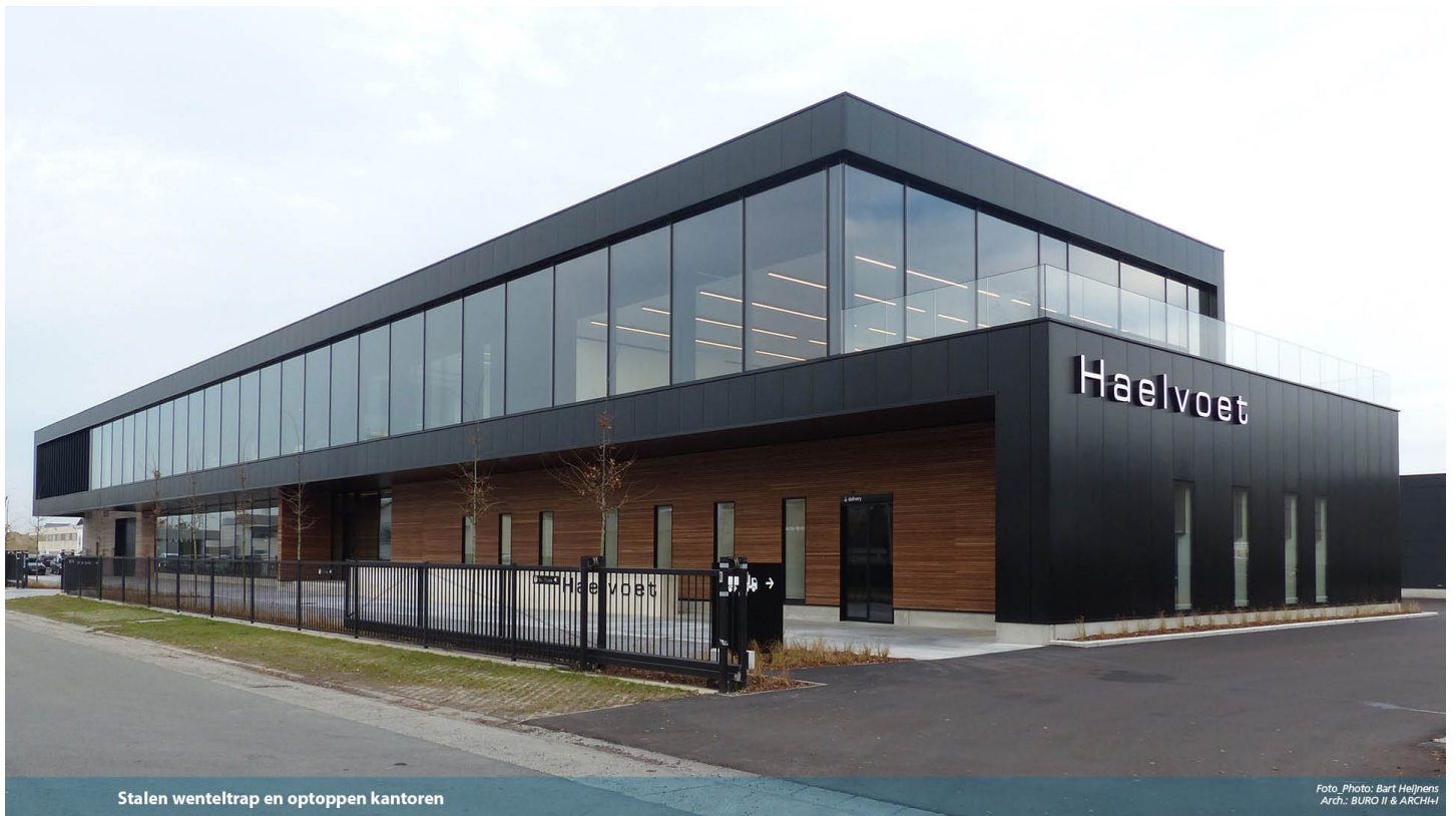
Stalen wenteltrap en optoppen kantoren

Arch.: BURO II & ARCHI