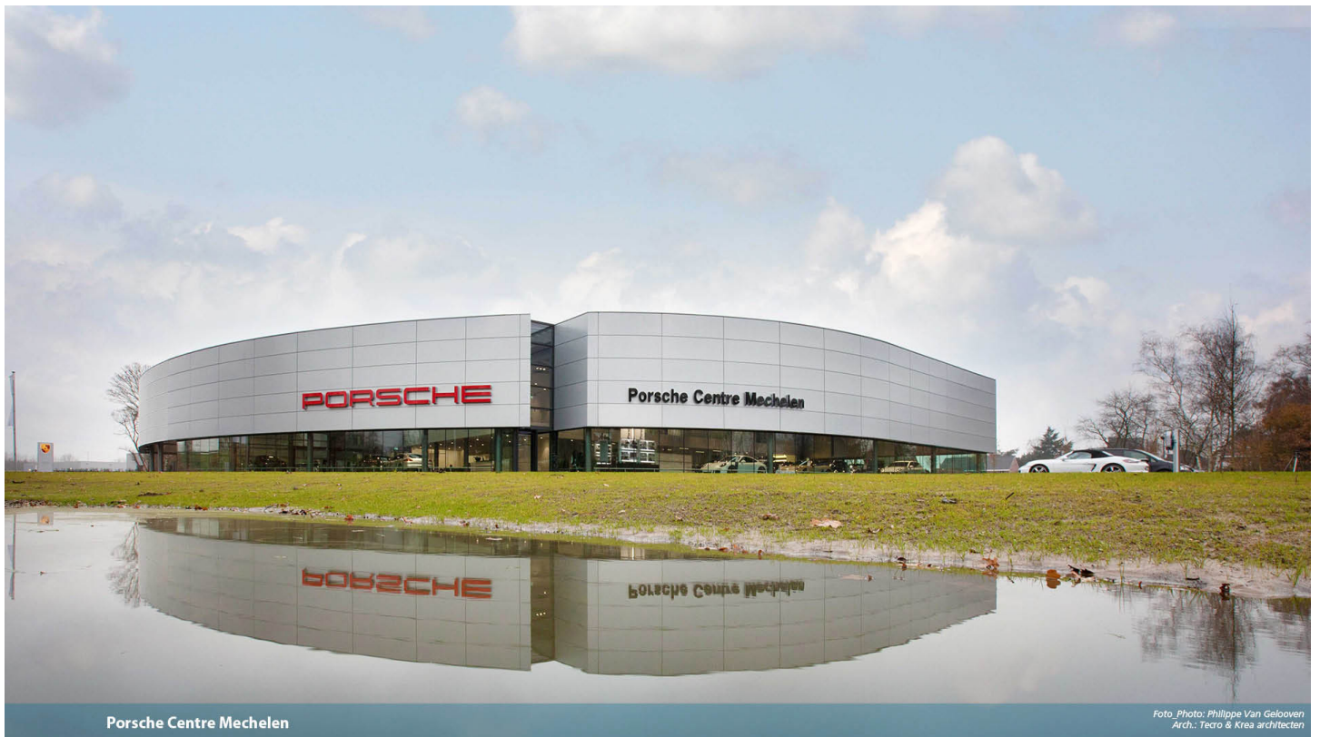
Porsche Centre Mechelen