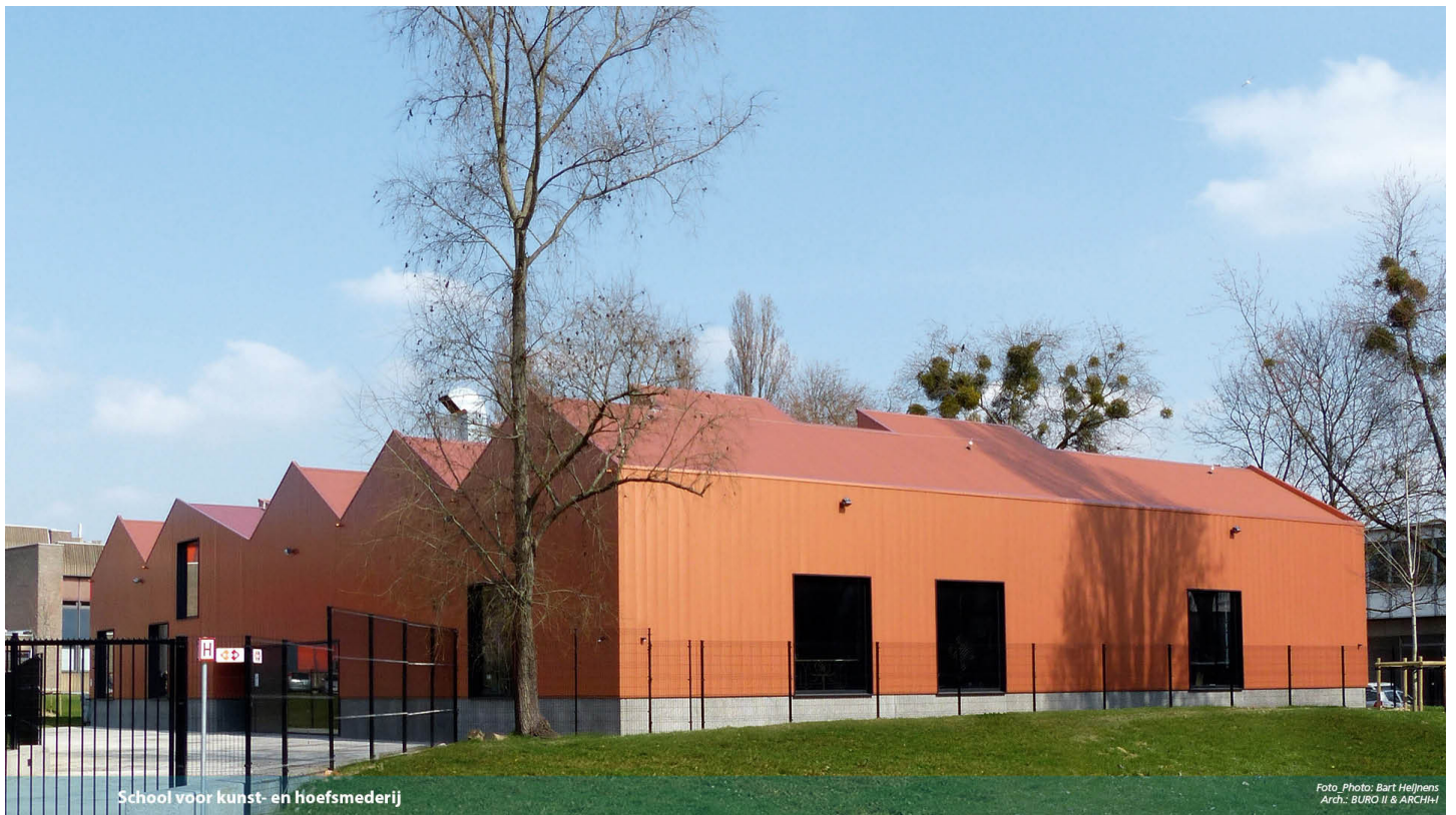
School voor kunst- en hoefsmederij