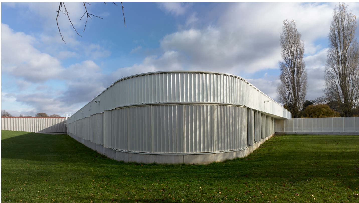
Architect: lava architecten